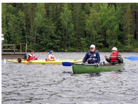
Kuva 5: Repovedellä on mahdollista retkeillä myös meloen.