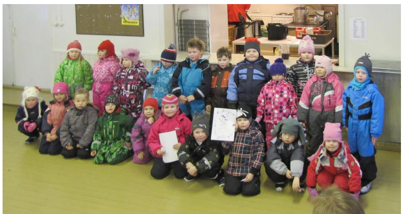
Kuva 1: Tutkintoladun suorittuaan hiihtokoululaiset kokoontuivat todistustenjakoon.

Muumien hiihtokoulussa opeteltiin seuraavat hiihtotekniikat: sauvoittahiihto, vuorohiihto, kaatuminen ja ylösnousu, tasatyöntö, askelkäännös kantojen ympäri, sivuttaisnousu, haaranousu, mäenlasku ja lapinkäännös. Muumien hiihtokoulussa hiihtotaitoja harjoiteltiin leikkien kautta ja toiminnassa tärkeää olivat hauskuus, ilo ja leikinomaisuus. Yhdellä kerralla tehtiin pieni hiihtoretki, jossa myös vanhemmat olivat mukana. Retkellä paistettiin nuotiolla Kausalan S-Marketin tarjoamat makkarat, ja nautittiin lämpimästä mehusta. Yksi hiihtokoulun kohokohdista oli Muumin vierailu. Viimeisellä kerralla lapset hiihtivät tutkintoladun, jota vanhemmat olivat seuraamassa. Hiihtokoulun päätteeksi kaikille jaettiin todistukset.