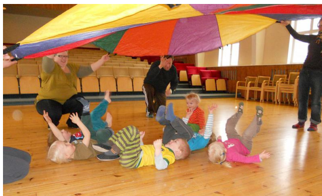
Kuva 2: Perhiksessä liikutaan leikin varjolla.

Perhis liikkui vuoroin sisällä ja ulkona. Sisäliikunnassa liikuntahallilla ja Ravilinna-salissa lapset vanhempineen liikkuvat sopivasti hiki päässä. Toiminta oli suunniteltu sisäliikuntaa ajatellen leikin varjolla toteutettavaksi. Milloin oltiin ”autoilla” liikenteessä, milloin eri korkeudella kulkevia eläimiä. Satuhahmot olivat myös vahvana mukana. Välillä juoksun tiimellyksessä kuului tytön tokaisu isälle: ”Mä en jaksa, juokse sä.” Rekvisiittana käytettiin mm. palloja, sanomalehtimailoja ja leikkivarjoa.