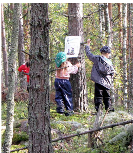
Kuva 6: Mörripolulla kuunneltiin, tunnusteltiin, hypittiin ja syötiin mustikoita.