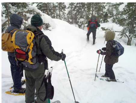
Kuva 3: Hiidenvuorelle voi kiivetä talvella.

Vuonna 2012 oli säännöllisiä tapahtumia kuten kuutamokävelyt ja -hiihdot. Lumikenkäily-, pyöräily- ja melontaretkiä järjestettiin myös. Alla ovat tapahtumat, jotka Iitin Latu on järjestänyt tai joiden järjestelyissä Iitin Ladulla on ollut merkittävä osuus.