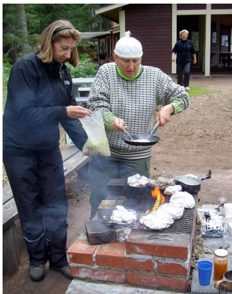
Kuva 4: Kuutsalon Santarannassa kokit saivat toteuttaa itseään.